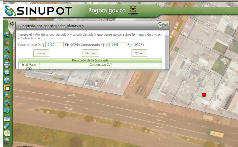
Figura 1. Localización valla Ultradifusion Ltda. AC. 100 No. 61-28 Coordenadas planas X:101201.50 Y:110348.82, sentido de orientación de la valla Oeste-Este