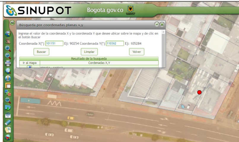
Figura 2. Localización valla Efectimedios S.A. AC. 100 No. 62-18 Coordenadas planas X:101151.89 Y:110362.85, sentido de orientación de la valla Este-Oeste